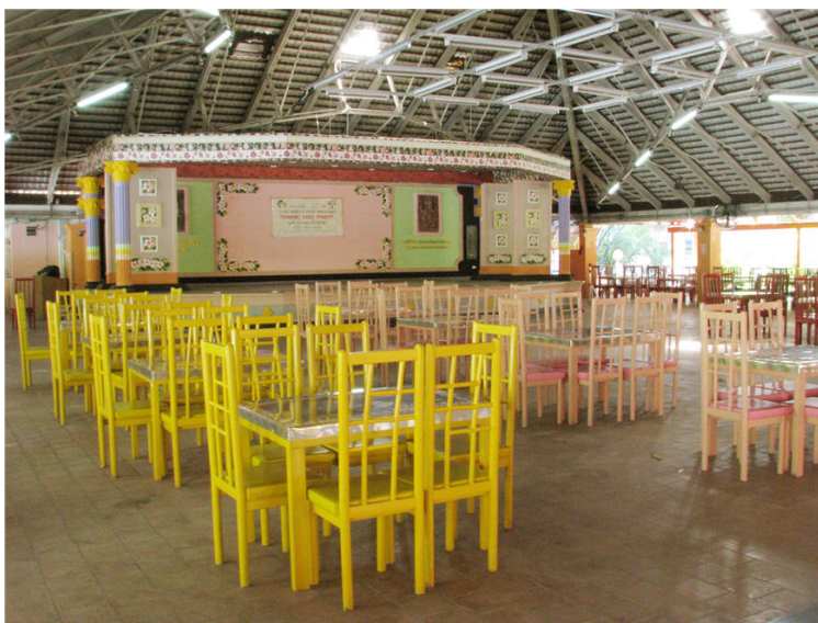
ภาพภายใน โรงอาหาร