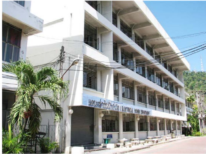
ภาพแผนกวิชาช่างไฟฟ้า