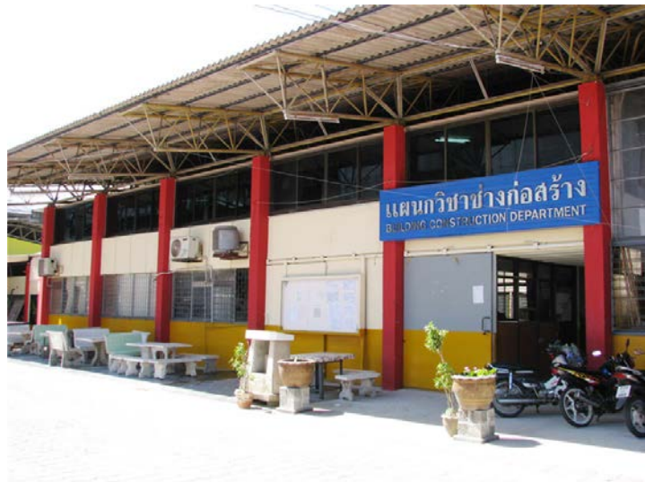
ภาพแผนกวิชาช่างก่อสร้าง