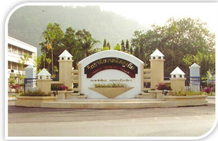
ภาพป้ายวิทยาลัยเทคนิคอุบลราชธานี