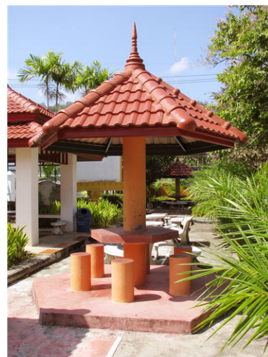
ภาพศาลานั่งพักผ่อน