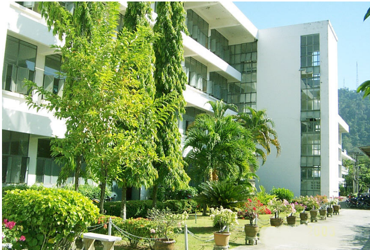
ภาพอาคาร 2 แผนกเทคนิควิศวกรรมหมืองแร่และสิ่งแวดล้อม และแผนกเทคนิคพื้นฐาน