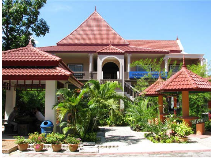
ภาพแผนกวิชาเทคโนโลยีสารสนเทศ