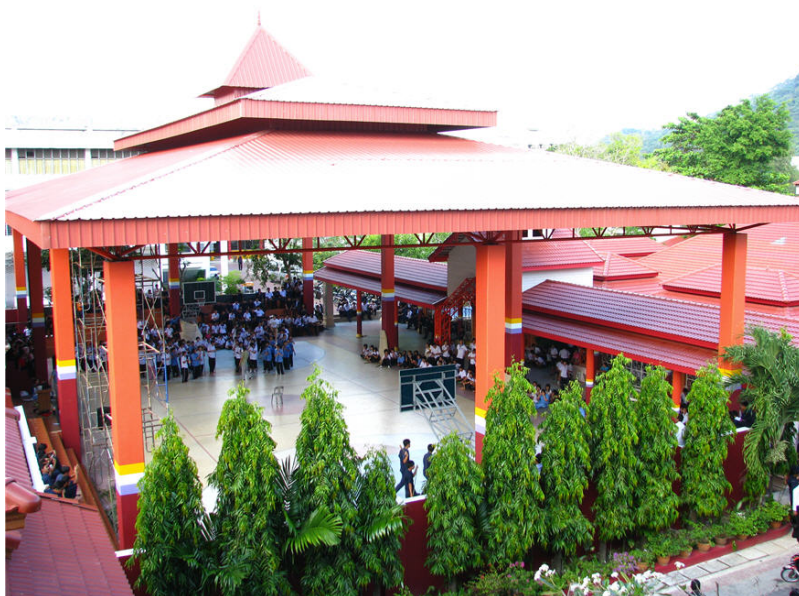
ภาพอู่อุฬารักษ์ยิม