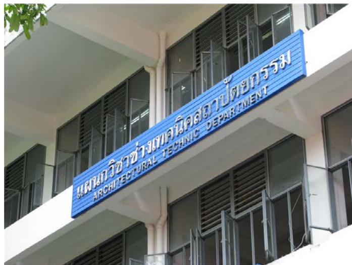
ภาพแผนกวิชาช่างเทคนิคสถาปัตยกรรม