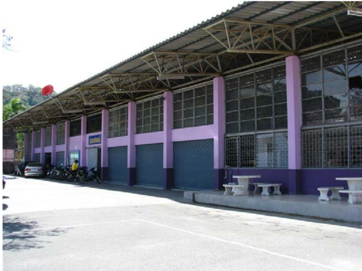
ภาพแผนกวิชาช่างยนต์